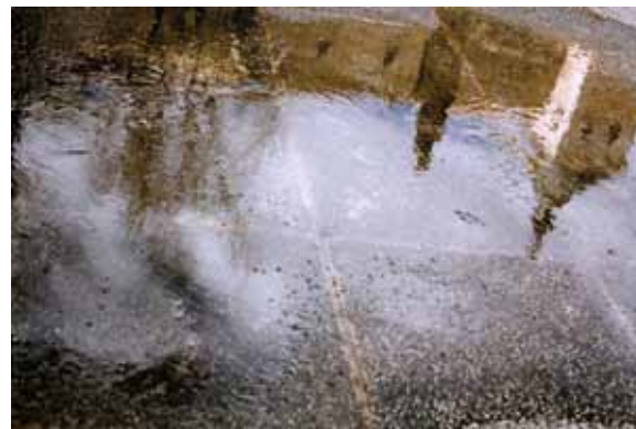
Valle García Ballesteros